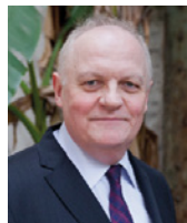
François ASSELINEAU Liste Île-de-France 56 ans | HEC | ENA | Inspecteur général des finances | ancien Délégué général à l'intelligence économique au ministère de l'économie et des finances | Président-fondateur de l'UPR

L'UPR présente des candidats dans toutes les circonscriptions